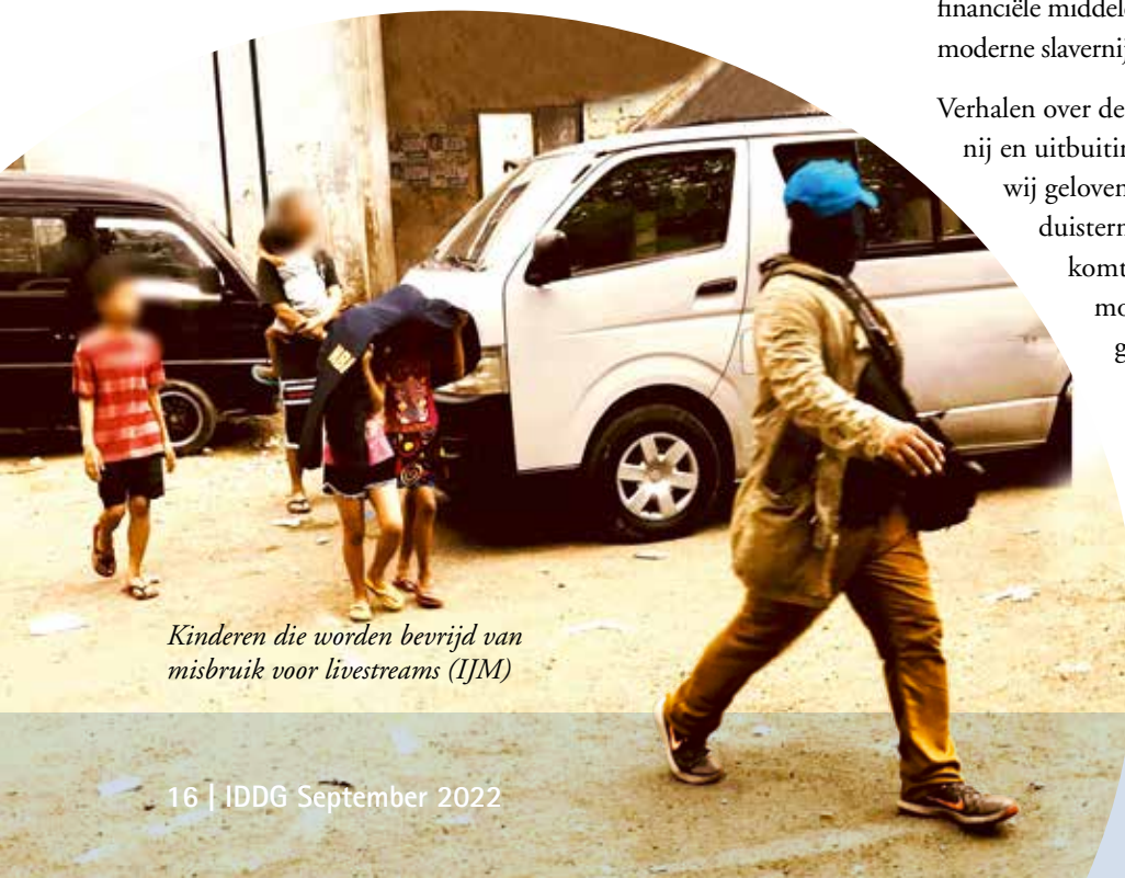
Kinderen die worden bevrijd van misbruik voor livestreams (IJM)

Wilt u meer weten over IJM of Prayer Partner of Freedom Partner worden? Zie www.ijmnl.org ✓