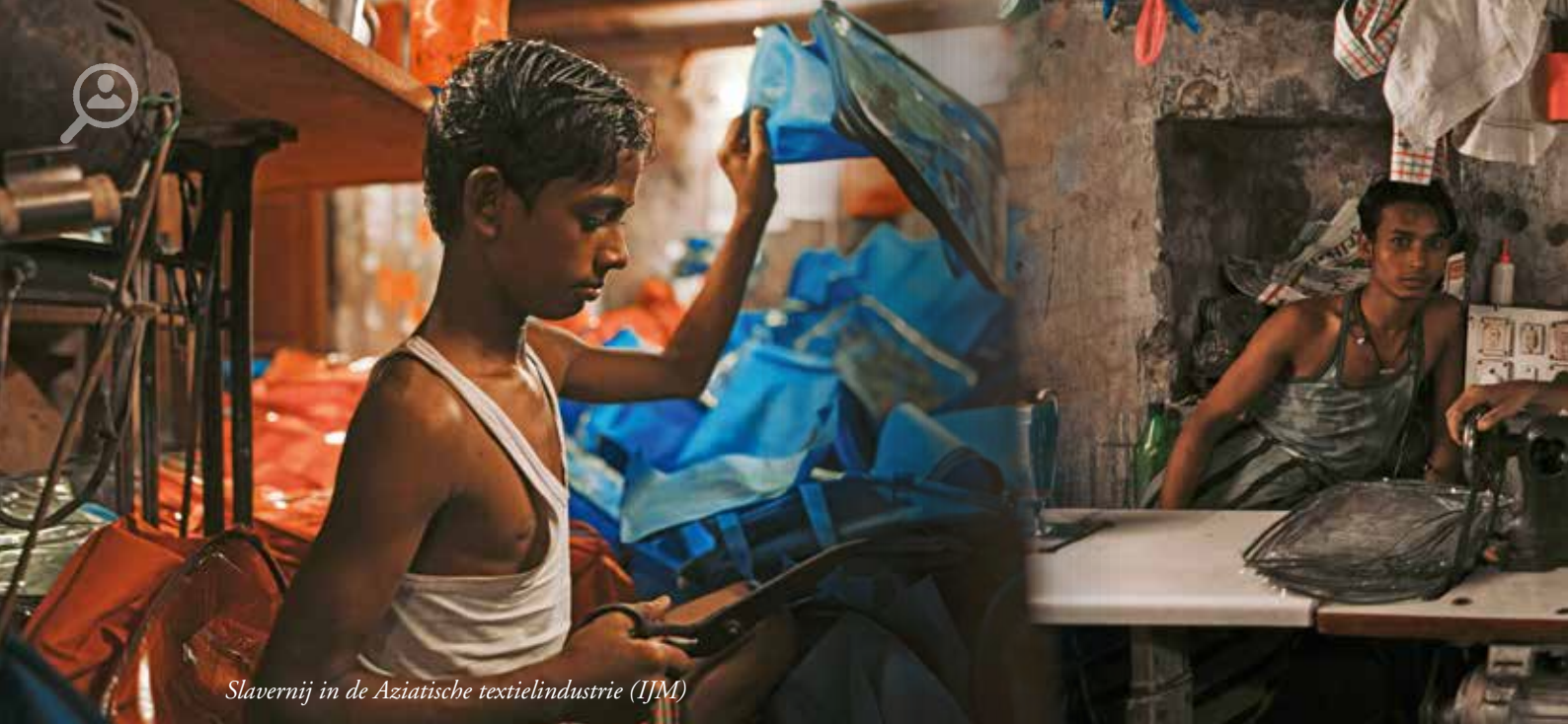
Slavernij in de Aziatische textielindustrie (IJM)